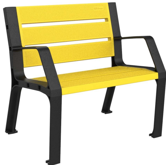
Imagen - 08PLAST-0860-AMA (Color amarillo)