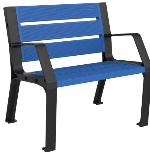
08PLAST-0860-AZU (RAL 5005)