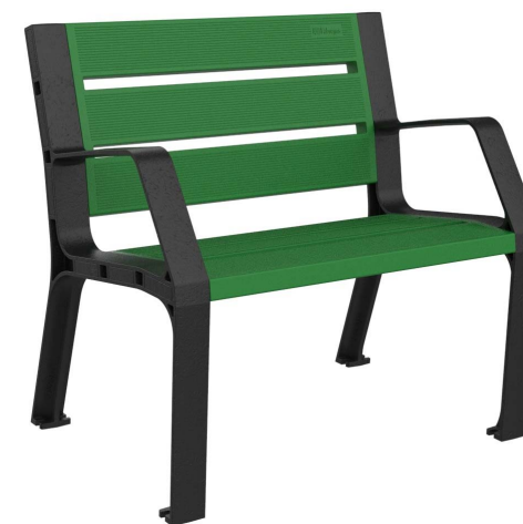
08PLAST-0860-VER (RAL 6029)