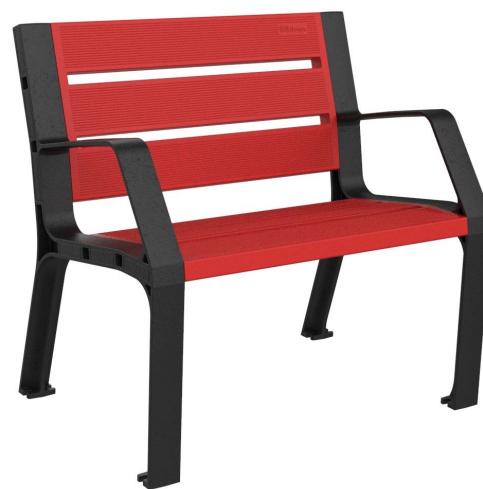
08PLAST-0860-ROJ (RAL 3020)