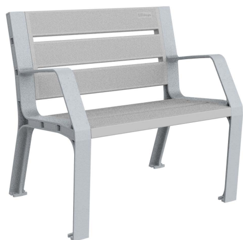
08PLAST-0860-PLA (Color plata)