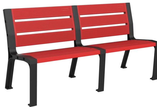
08PLAST-1650-ROJ-SIN (RAL 3020)