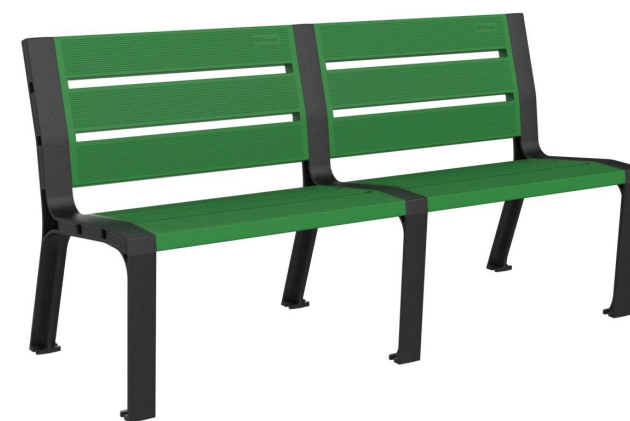
08PLAST-1650-VER-SIN (RAL 6029)