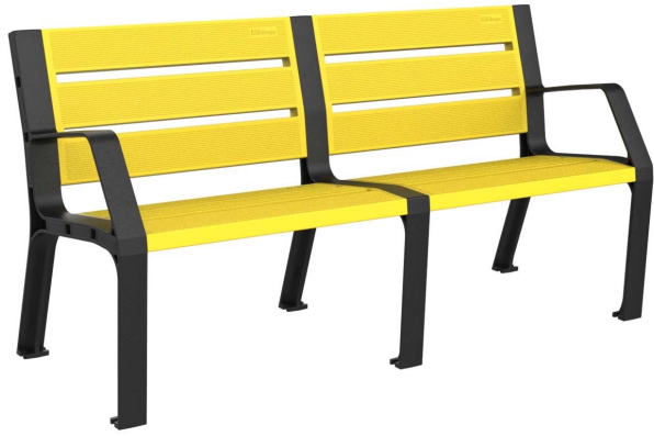
Imagen - 08PLAST-1650-AMA (Color amarillo)