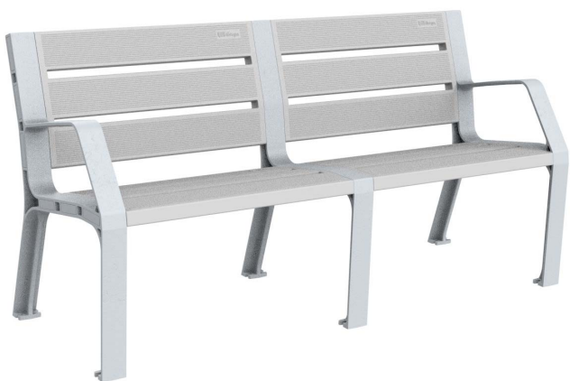
08PLAST-1650-PLA (Color plata)