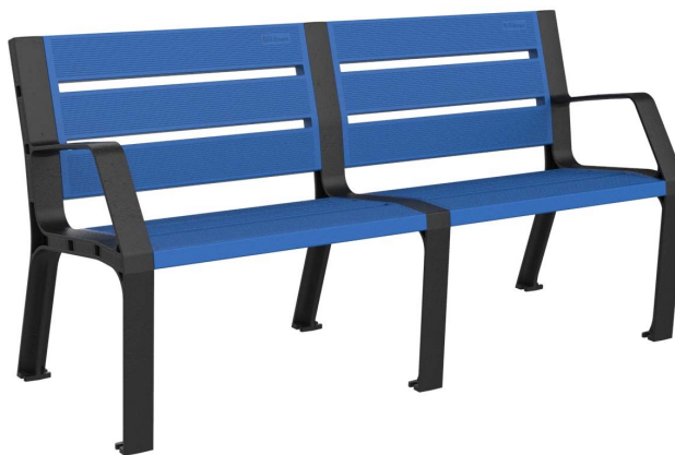
08PLAST-1650-AZU (RAL 5005)