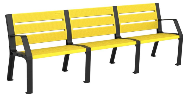
Imagen - 08PLAST-2440-AMA (Color amarillo)