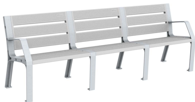
08PLAST-2440-PLA (Color plata)