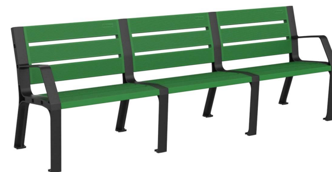
08PLAST-2440-VER (RAL 6029)