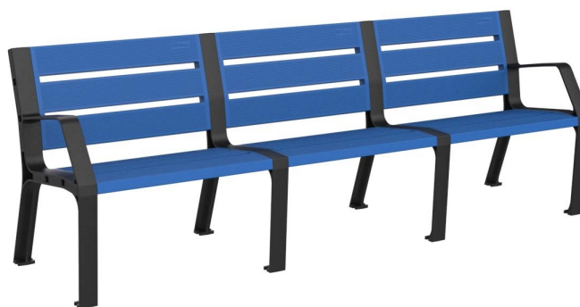
08PLAST-2440-AZU (RAL 5005)