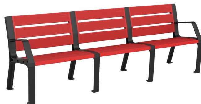
08PLAST-2440-ROJ (RAL 3020)